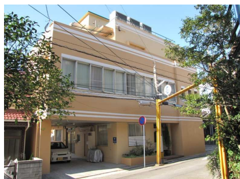
小規模多機能ホームわかばハウス

わかば会の小規模多機能 当法人の小規模多機能型居宅介護は、浜野病院から徒歩2分の有料老人ホームわかばハウス内にあり、1階が泊り（5床）、2階が住宅型有料老人ホーム（11床）、3階が「通い」のスペースとなっています。 小規模多機能の「通い」では、里山療法の一環として、トウモロコシの観察研究や植物の栽培などを行い、現在は春に向けてソラマメやチューリップなどを育てています。 また家庭的な雰囲気の中で自分のペースにあった空間で過ごし、手芸やクロスワードなどの個々の趣味活動を行い、他にもリハビリとしての歩行訓練や脳の活性化のためのタッチパネル式の計算問題など、健康維持の面でのサービスも整っています。