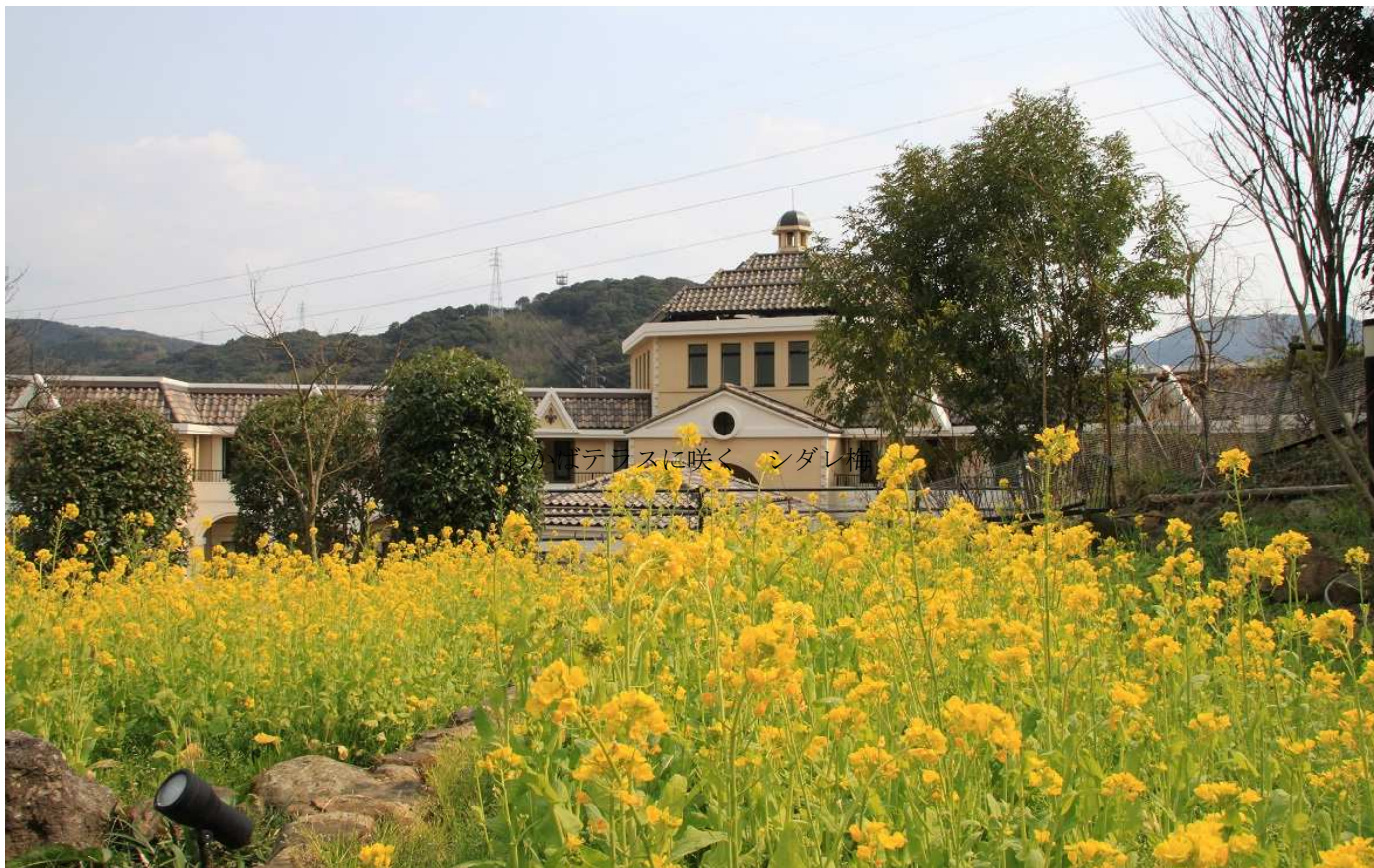
わかばテラスに咲く菜の花

編集・発行／医療法人わかば会 〒857-0016 佐世保市俵町 22-1 Tel 0956-22-6548 Fax 0956-24-7270 http://www.wakabakai.or.jp